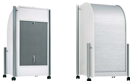
geschlossene Container von hinten